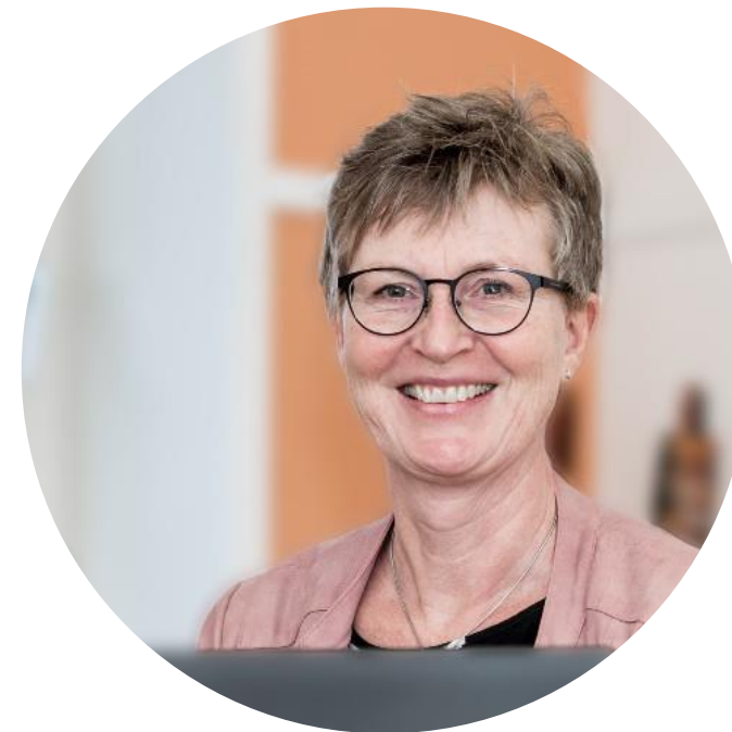
Pia svarer på telefonen