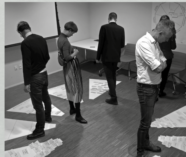
FOTO: Kortlægning af cirkulære potentialer i workshop med ISWA.

»Laboratoriet for Bæredygtighed undersøger, viser og arbejder med, hvordan bæredygtighed kan være en stimulator for vækst og forandring«